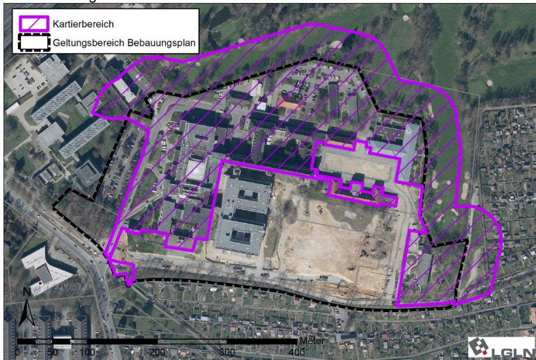
Abbildung 1: Kartierbereich und Geltungsbereich des parallelen Bebauungsplanes

Am nördlichen und östlichen Rand des Plangebiets wird ein 50 m breiter Pufferbereich in das Untersuchungsgebiet einbezogen. Das vorliegend betrachtete Untersuchungsgebiet stellt sich somit folgendermaßen dar: