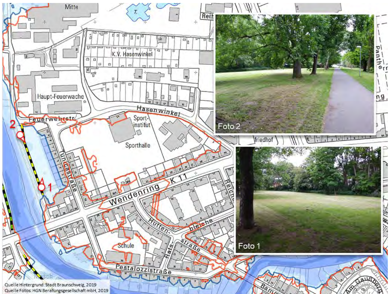
Abbildung 3 Übersicht potentieller HWS-Trasse entlang der Tunicastrasse

Im Bereich der Tunicastrasse stellt sich im HQ 100 -Szenario eine Betroffenheit der Hausnummern 2 bis 10 ein. Zu deren Schutz ist die Errichtung einer HWS-Verwallung/Mauer im Bereich des westlich gelegenen Grünstreifens mit entsprechendem Anschluss im Norden und Süden denkbar. Im Bereich der potentiellen HWS-Trasse stellen sich Wassertiefen von bis zu 0,50 m ein.