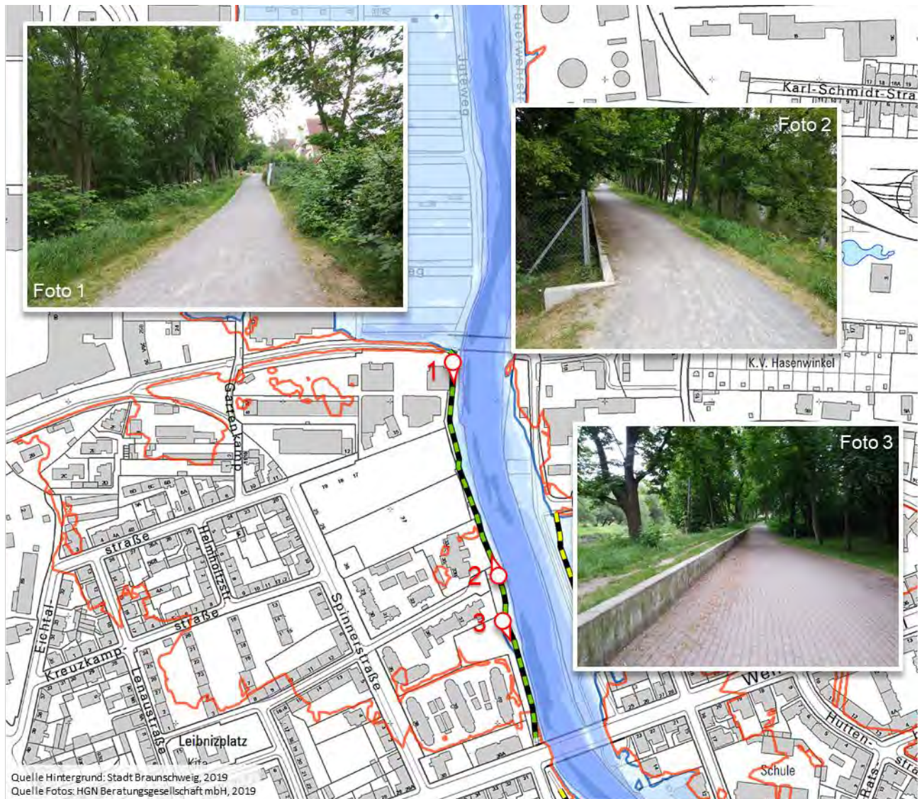
Abbildung 4 Übersicht HWS-Trasse entlang der Spinnerstraße

Die seinerzeit errichtete HWS-Maßnahme entlang des Okerufers im Bereich der Spinnerstraße wirkt bis zu einem HQ 100 -Ereignis. Hierbei ist der Freibord jedoch gänzlich ausgeschöpft, sodass die sich während eines HQ extrem -Ereignisses einstellenden Ausuferungen bis zur Straße Eichtal im Westen und bis zum Wendenring im Süden reichen. Betroffen sind neben zahlreichen Wohngebäuden auch Gebäude des Einzel- und Großhandels sowie die DRK-Kindertagesstätte direkt am Oker-Ufer.