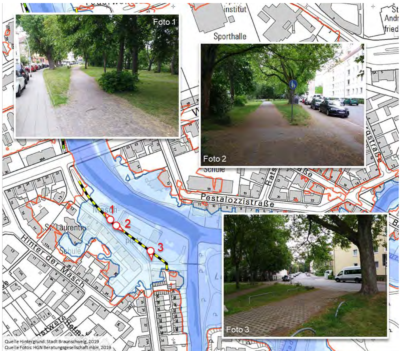
Abbildung 2 Übersicht potentieller HWS-Trasse entlang der Maschstraße

Im Bereich des Maschplatzes verläuft von befindet sich eine leichte Geländesenke, welche sowohl beim HQ 100 -Szenario, als auch beim HQ extrem -Szenario von den Überflutungen betroffen ist. Diese Senke zieht sich vom Wendenring im Norden, bis zur Kreuzung Hinter der Masch und Maschstraße. Betroffen sind neben Wohngebäuden auch das anliegende Vereinsheim des Ruder-Klubs „Normannia“ eV sowie die Gebäude der St. Laurentius Kirche und die Grundschule Hinter der Masch.