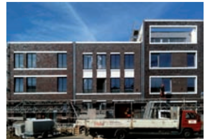
Stadthäuser St. Leonards Garten, Braunschweig Giesler Architekten