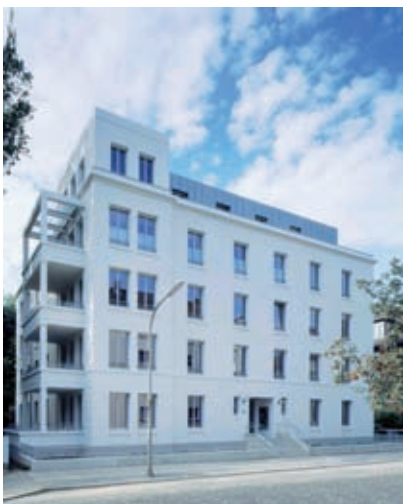
Haus am Gausberg, Braunschweig Giesler Architekten

Auf die Art und Weise, wie ein Gebäude optisch auf dem Boden steht und wie es seinen oberen Abschluß findet, sollte großer Wert gelegt werden. Der o.g. Charakter kann hierbei z.B. durch plastische Detailausformulierungen erreicht werden. Ebenso sollten die Öffnungen plastisch hervorgehoben werden.