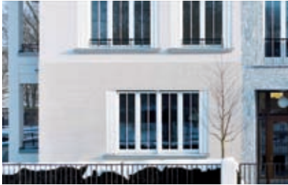
Wohnhaus Diplomatenviertel, Berlin Hilmer & Sattler und Albrecht

Eingänge sollten angemessen in die Fassade integriert werden. Hierbei ist auf Vordächer möglichst zu verzichten und ein Wetterschutz muß z.B. in Form eines Unterschnittes der Fassade entwickelt werden.