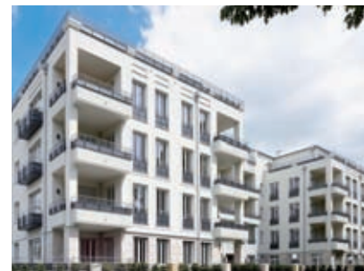
Klostergärten, Münster Hilmer & Sattler und Albrecht