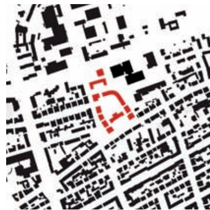
Schwarzplan Entwurf Giesler Architekten