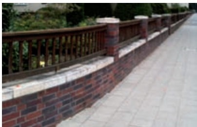
Beispiel für eine Sockelmauer

Nebenanlagen sind in dem vom öffentlichen Straßenraum und von der Parkanlage einsehbaren Bereichen nicht zulässig. Einhausungen von Abfallbehältern sollen in die Sockelmauer integriert werden. Eventuell erforderliche Abstellmöglichkeiten oder Trennelemente in den Gärten sollen als Bestandteil der Gebäudearchitektur aufgefasst werden.