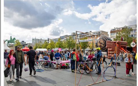
Einwohner mit den Basketball Löwen, Spielplatz für die ganze Familie und zahlreiche Sportarten entdecken – das trendsporterlebnis, präsentiert von Volkswagen Financial Services, lockte viele Besucherinnen und Besucher auf den Schlossplatz.