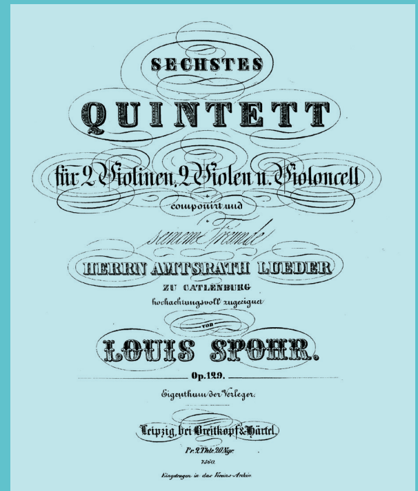
Titel Spohr Streichquintett Nr. 6 op. 129, Erstausgabe Verlag Breitkopf & Härtel, Leipzig 1845