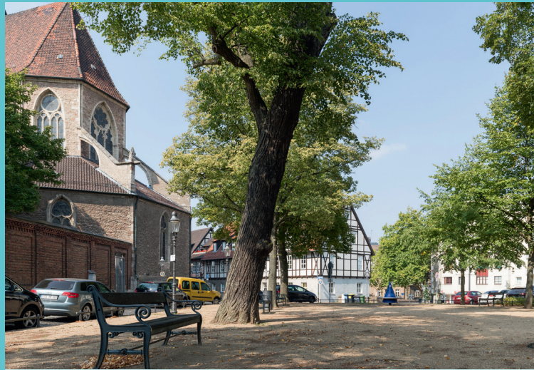
St. Aegidien und Spohrplatz

Louis Spohr (1784-1859), der sich stets seiner Geburtsstadt Braunschweig verbunden fühlte, verband gerne berufliche mit privaten Besuchen, insbesondere in Hinblick auf die Musikfeste in Braunschweig, wo er oftmals mit eigenen Werken auftrat. Anlässlich der Aufführung seines Oratoriums „Der Fall Babylons“ unter seinem Dirigat beim Musikfest Braunschweig 1844 in der Aegidienkirche ist in seiner Selbstbiografie zu lesen: