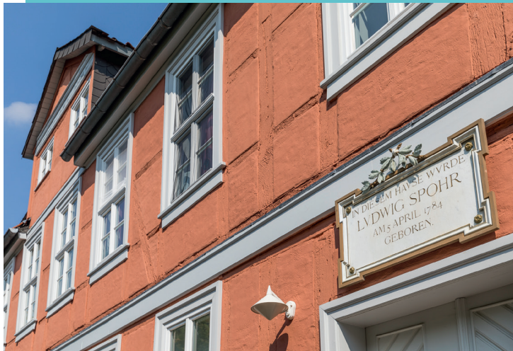
Spohrs Geburtshaus, Spohrplatz 7

„Der Umstand, daß die Aufführung in derselben Kirche stattfand, wo er vor mehr als 60 Jahren als zartes Knäblein die heilige Taufe empfangen, erhöhte noch die Weihe des Tages und gab wiederum Veranlassung zu manchem schönen poetischen Erguß.“