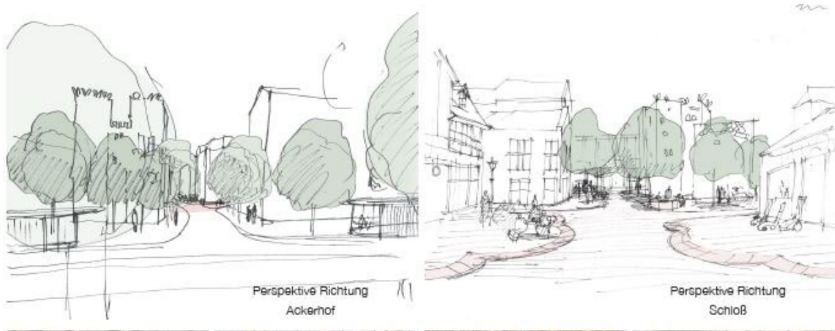
- Erste Ideenskizzen Ackerhof (Welpvon Klützing Braunschweig)

Träger: Stadtplanungs-, Verkehrs-, Tiefbau- und Baudezernat