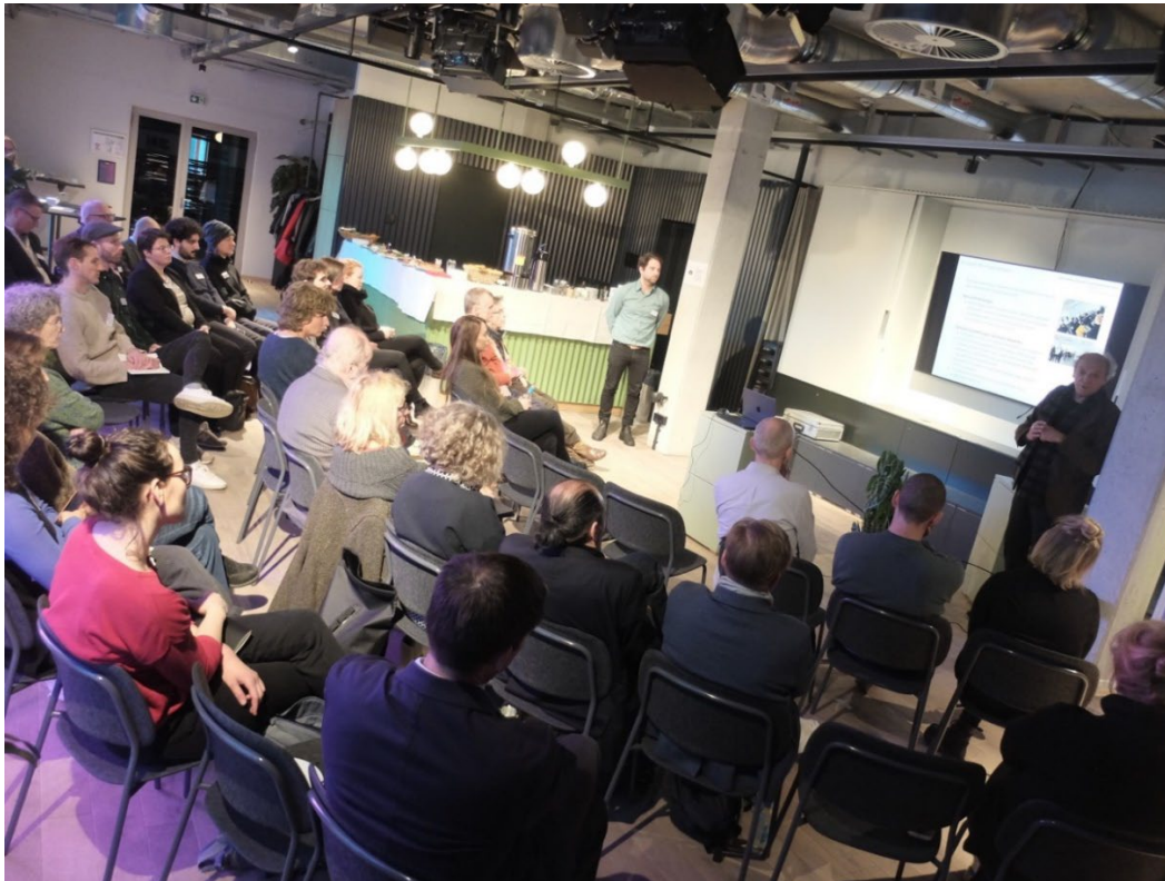
Workshop mit Kulturschaffenden und Vertreter:innen der Immobilienbranche am 17.01.2023, 14.00 bis 18.00 Uhr im 381

Träger: Kultur- und Wissenschaftsdezernat