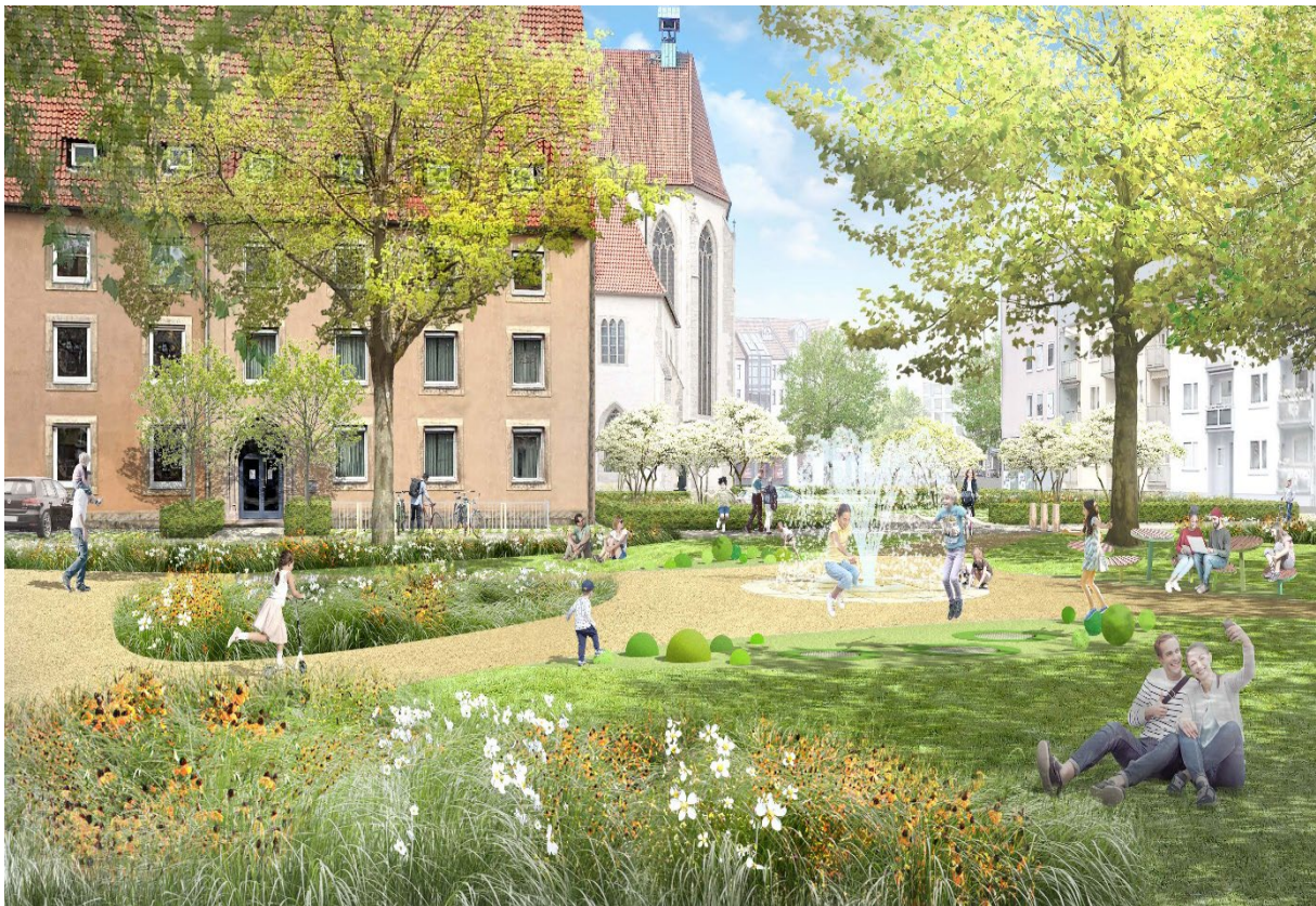
Abbildung 1: Büro Levin Monsigny, Berlin

Träger: Umwelt-, Stadtgrün-, Sport- und Hochbaudezernat