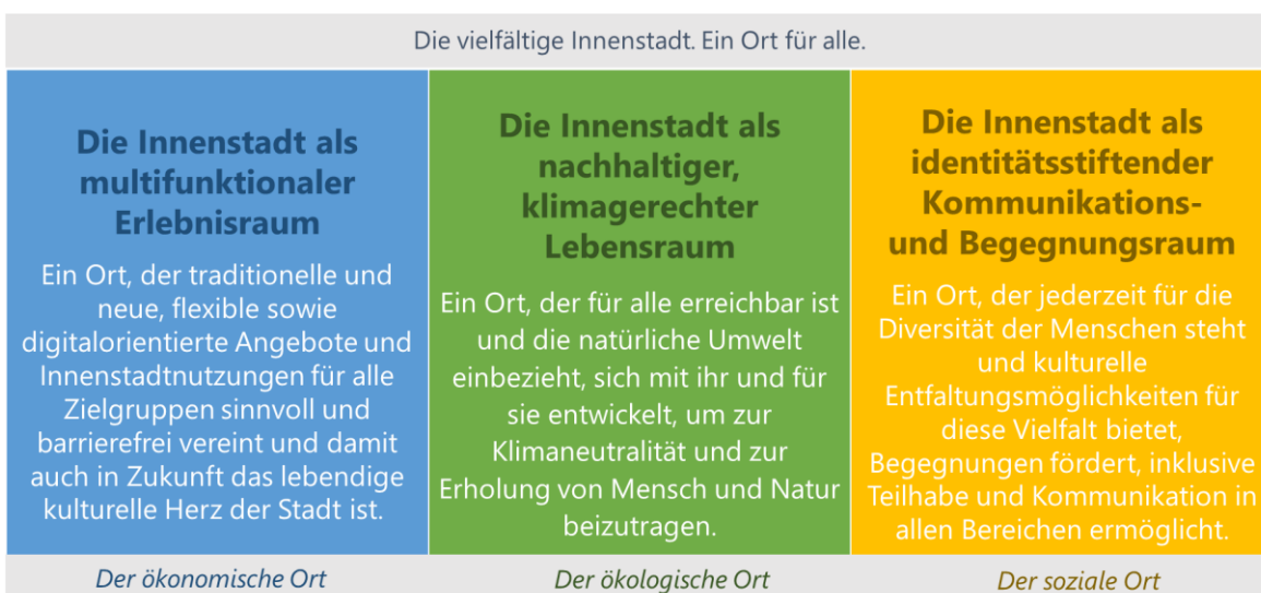
Abbildung 2: Das Leitbild für eine positive Innenstadtentwicklung

Auch die formulierten Querschnittsziele des strategischen Rahmenkonzepts wurden innerhalb aller Handlungsfelder berücksichtigt und finden sich damit im übergeordneten Leitbild wieder. Alle relevanten Akteursgruppen wurden hierfür in die Ausarbeitung und Abstimmung der Leitlinien sowie Handlungsfelder eingebunden.