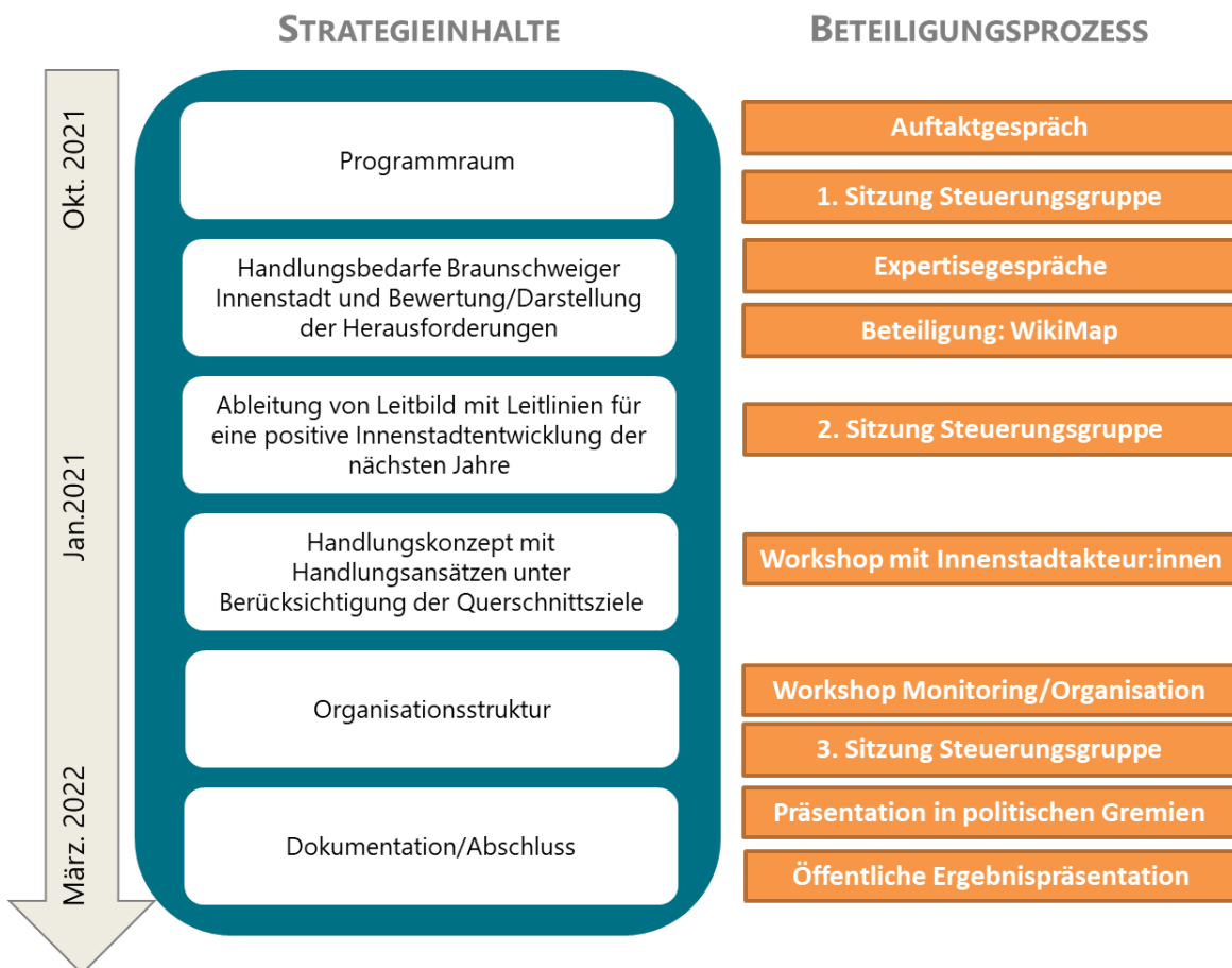
Abbildung 6: Prozessverlauf Strategieerstellung

Im Laufe des Prozesses fanden drei Sitzungen der Steuerungsgruppe für die Strategieerstellung statt. Die Ableitung des Programmraums, des Handlungsbedarfs und -konzepts, der Querschnittsziele und des künftigen Strategieumsetzungsprozesses wurde laufend vorgestellt und unter Einbezug fachübergreifender Expertisen und zivilgesellschaftlicher Akteur:innen diskutiert, um einen breiten, abgestimmten Konsens zu erzielen.